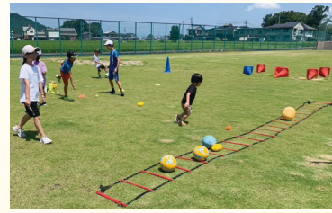
健全な発育発達を促すコーディネーション運動遊び教室の様子