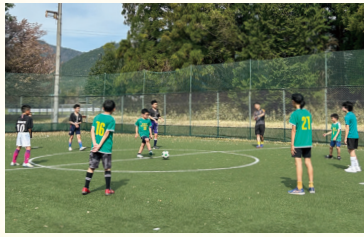
仲間と協調しながらサッカーを学ぶ様子